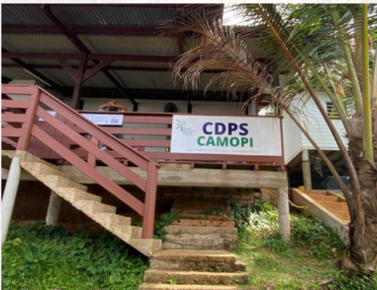
Relocalisation du CDPS de Camopi