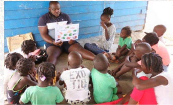
2022 Intervention buccodentaire à Bov Kondé (Grand Santi)

+ de 450 actions de santé publique sur le territoire , la création d'une équipe expérimentale sur les métaux lourds à Camopi/Trois Sauts et une coopération internationale avec le Brésil : projet Oyapock Coopération Santé